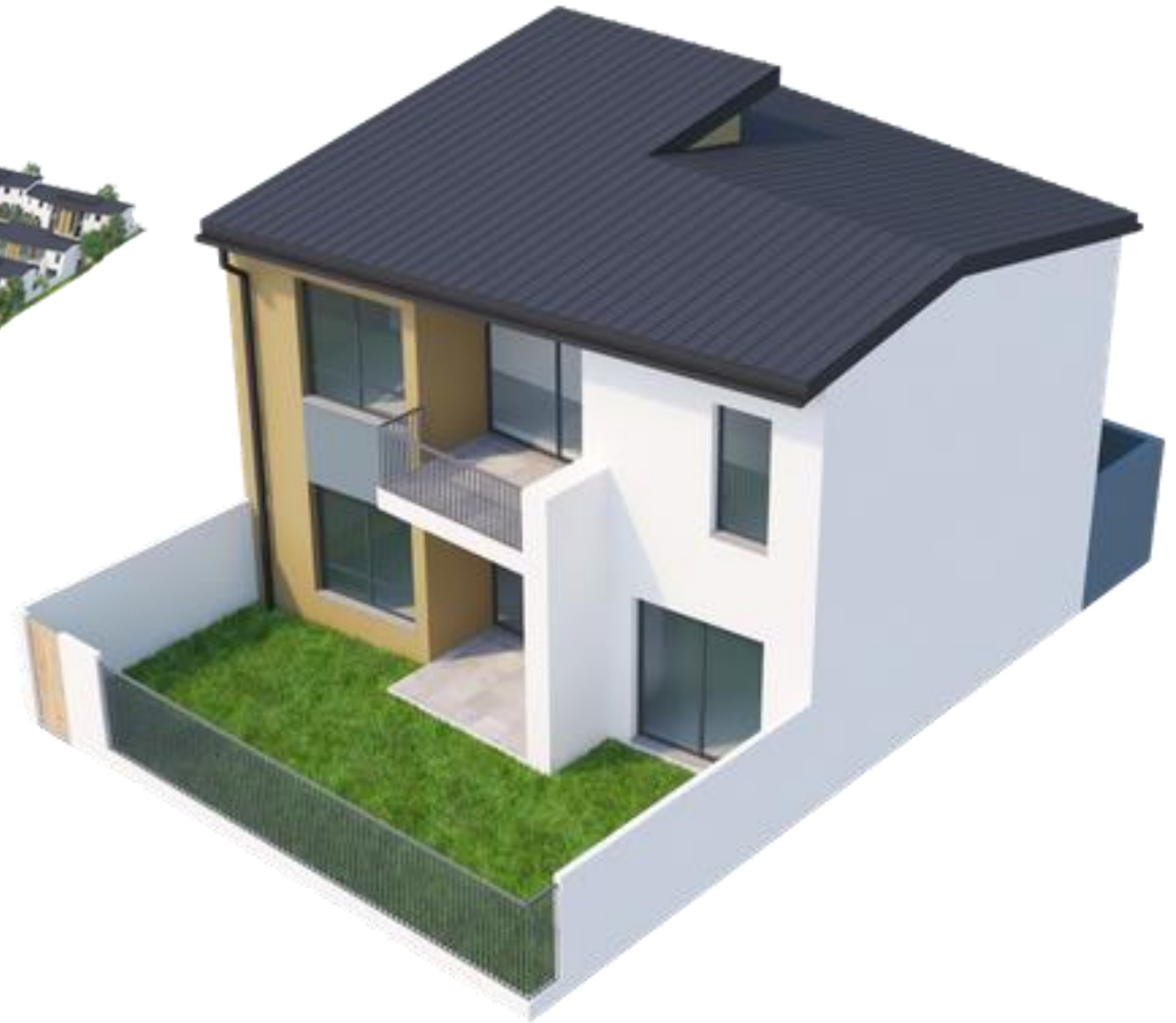
VUE 3D DE LA VILLA DUPLEX